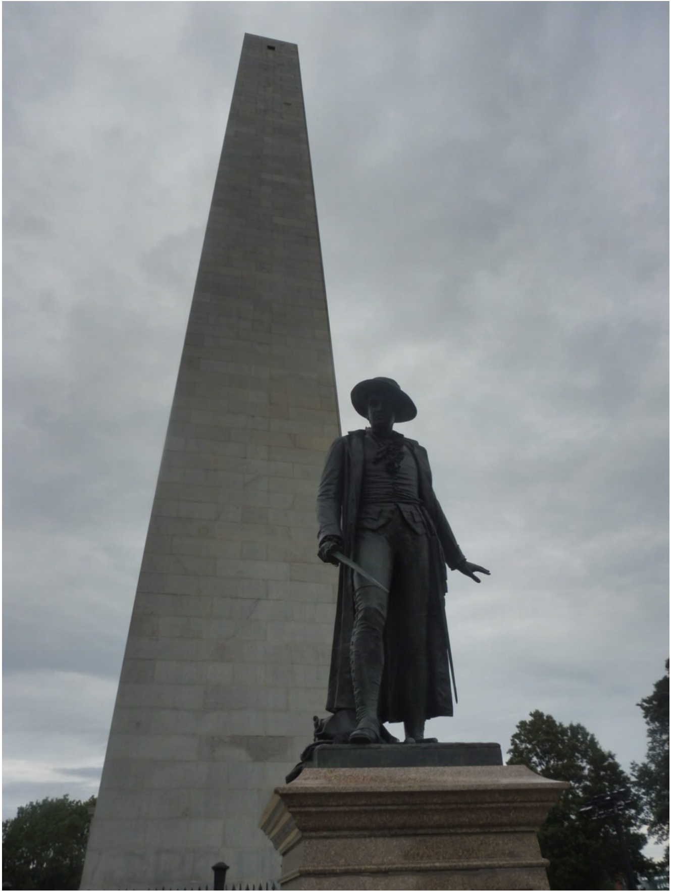
Bunker Hill Monument!