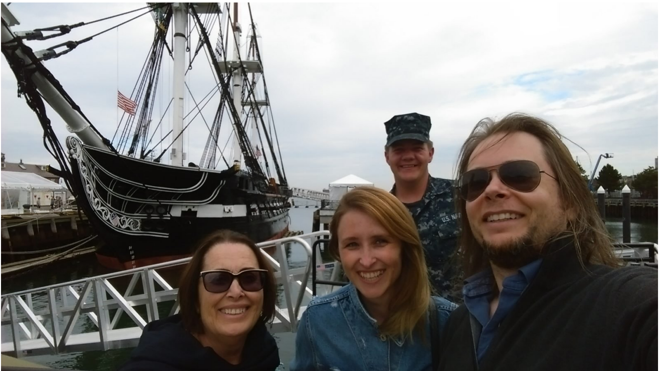
Nós, o barco...e o oficial da Marinha que pediu para fazer parte da nossa selfie!