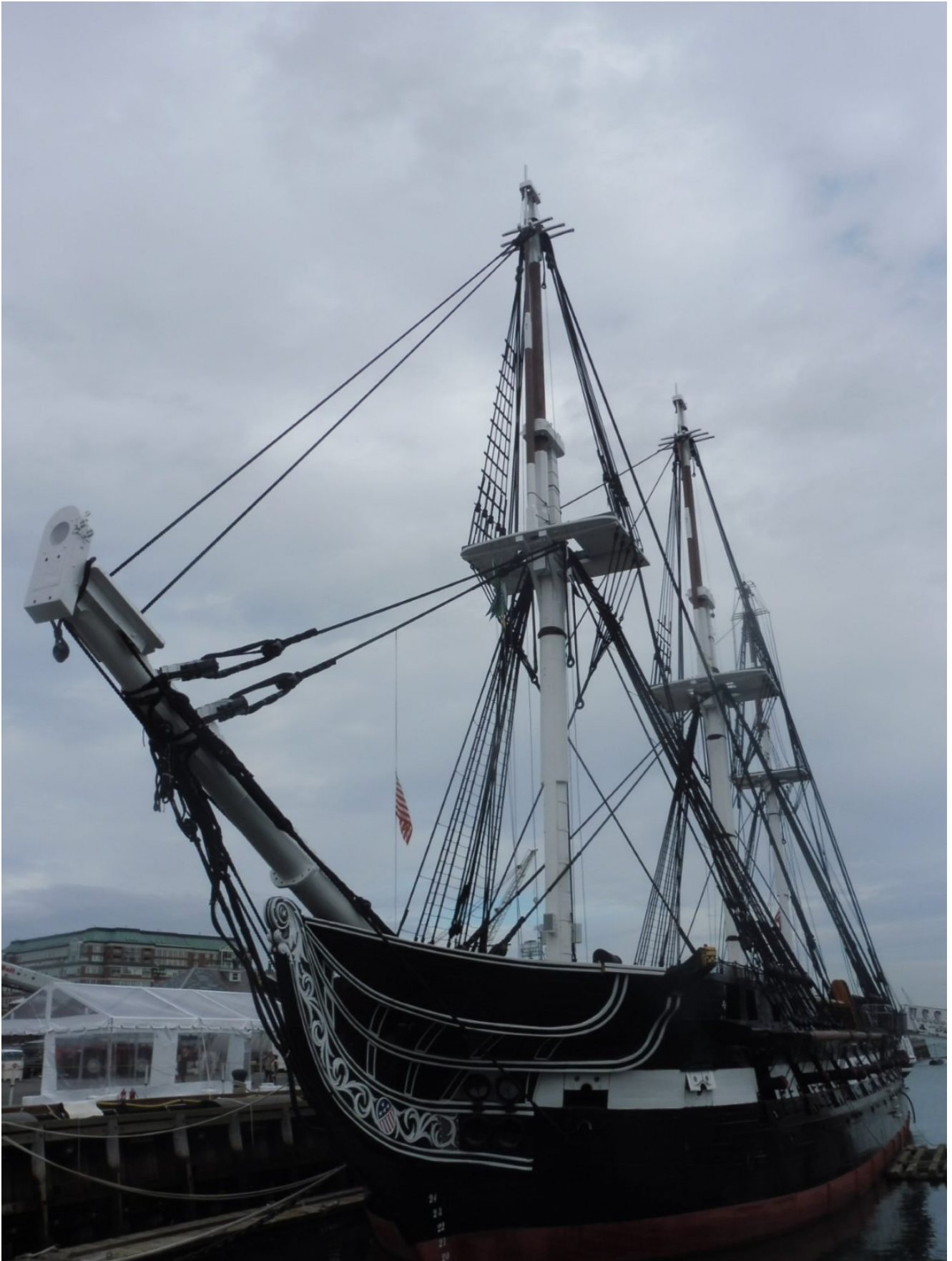
— — — ▪ Massachusetts State House