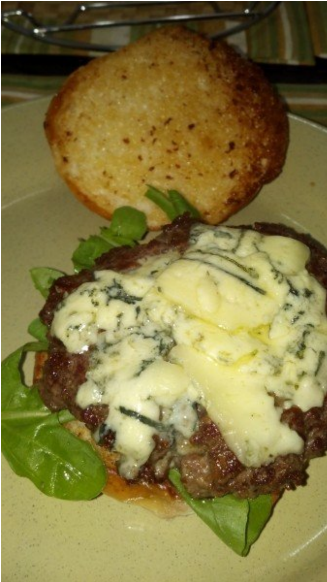
Acima o pãozinho depois de leve tostada na frigideira.