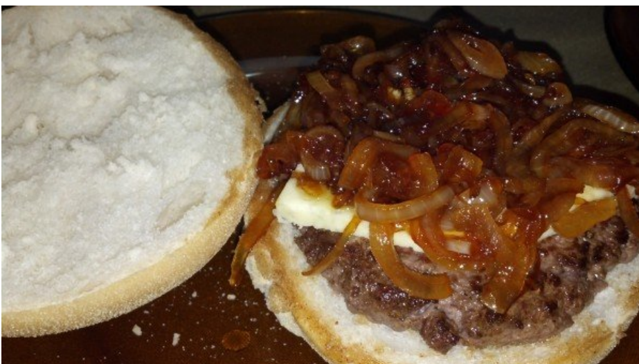
Versão Gorgonzola com Cebola Caramelada...fica