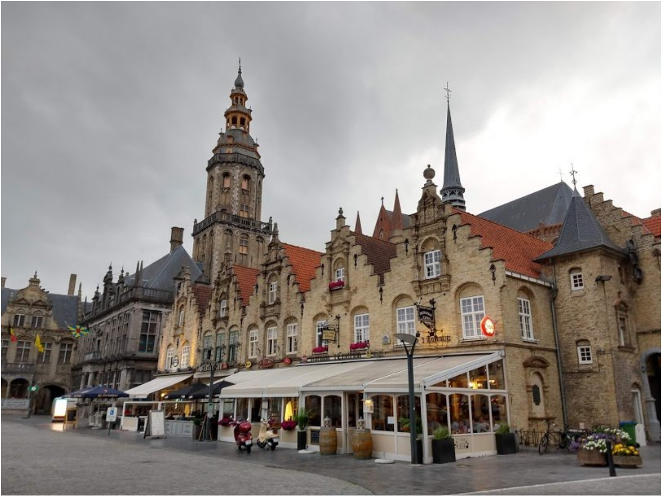
Praça central de Veurne.