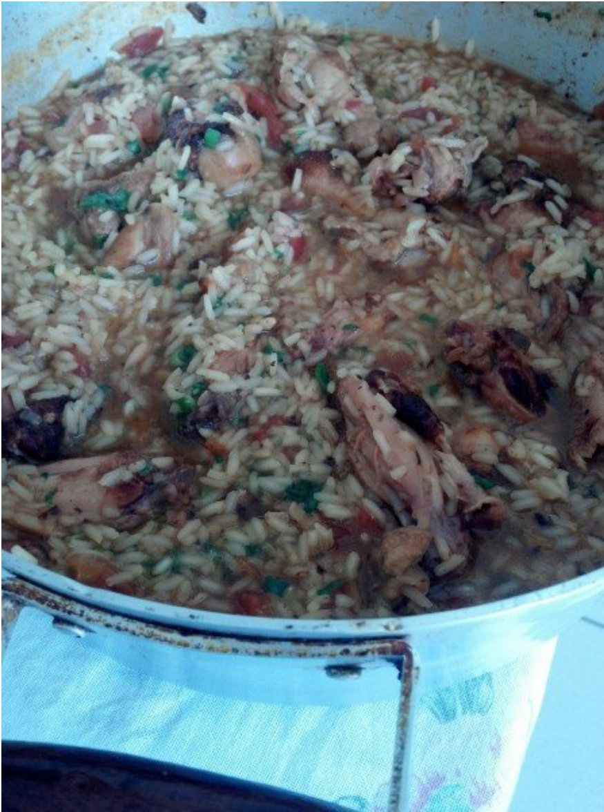
Galinhada succulenta, tipo risotto.