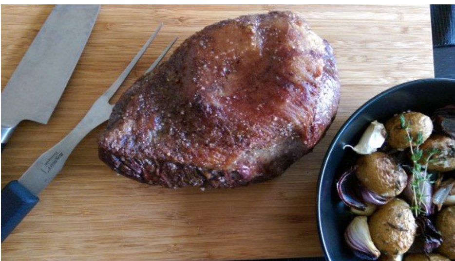
Picanha no forno com batatas.