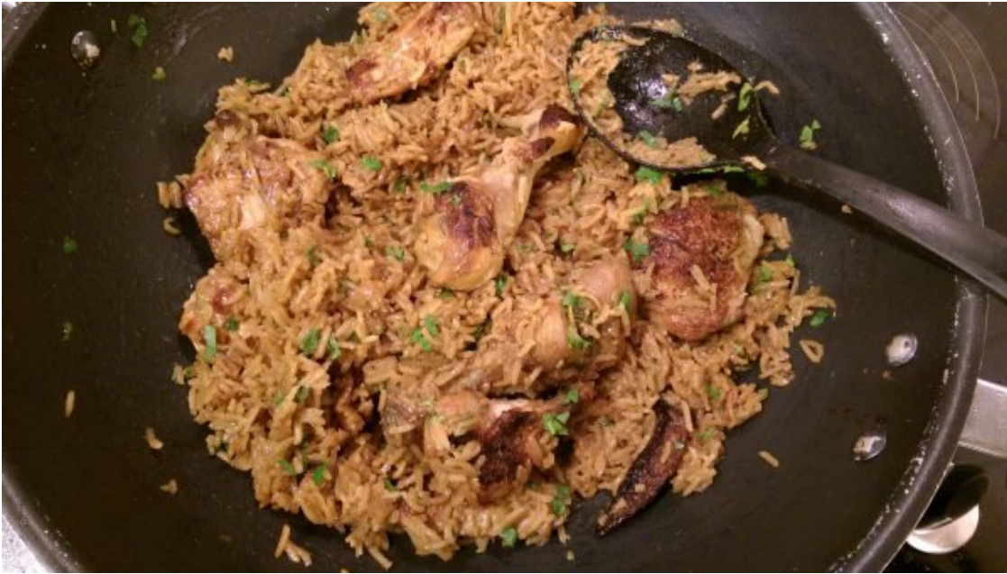
Galinhada sequinha, com arroz soltinho!