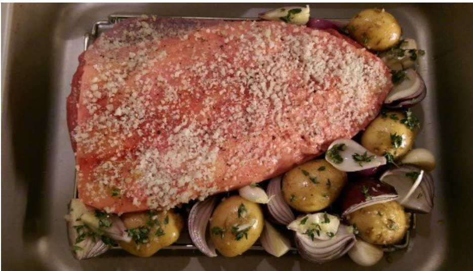
Picanha pronta para ir ao forno!