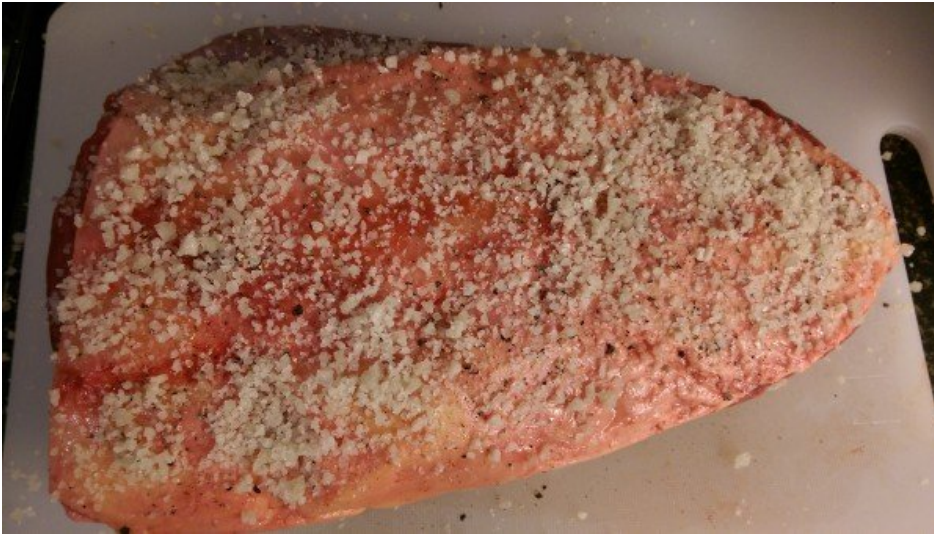
Temperando a picanha.