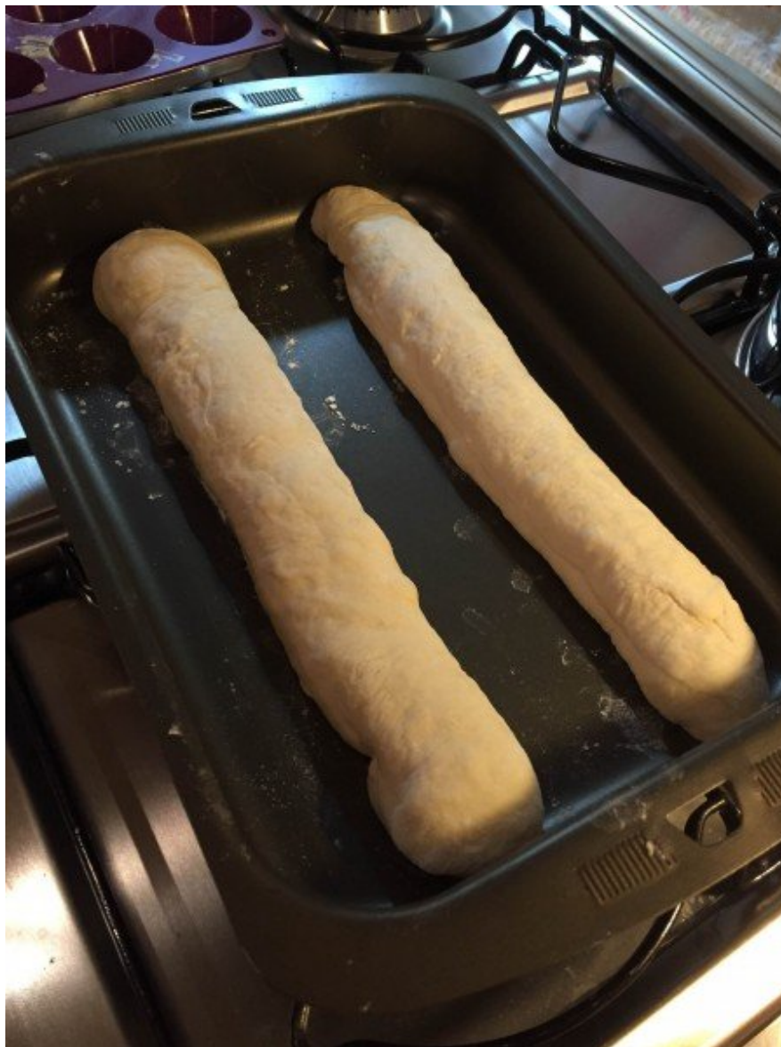
Baguetes descansando na forma.

Enquanto os pães descansam, enchemos um recipiente com água e o colocamos no forno a 250 graus. Esse passo é importantíssimo, pois a umidade é essencial para garantir aquela crosta crocante típica das baguetes.