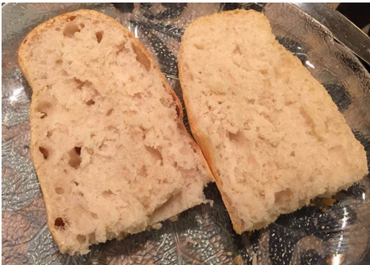
Baguete cortada ao meio