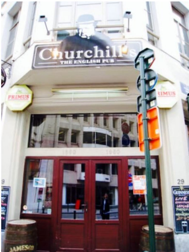
Entrada do Churchill's.

Decoração, TV's para jogos, música inglesa, mesa de sinuca e cervejas de todo o Reino Unido – além, é claro, de boas cervejas belgas, são a pedida para quem já está curtindo a cidade há um bom tempo e está a fim de mudar de ares. O Churchill's também é uma opção animada para happy hour e vez ou outra conta com música ao vivo.