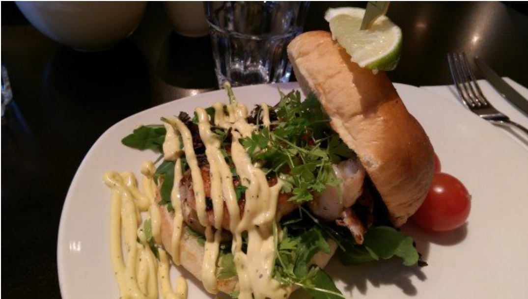
Hamburguer de Lagosta.

O atendimento é bom e recomendo que nos finais de semana, estejam no local logo no começo do serviço para não precisar ficar esperando, pois o local é um pouco disputado. O restaurante aceita reservas.