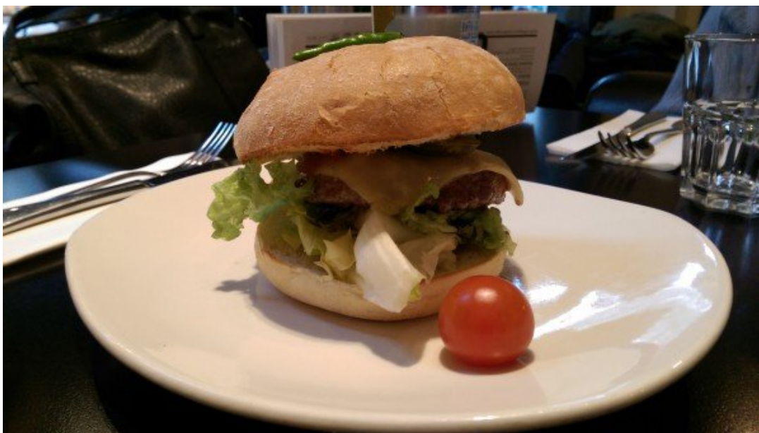
Hambrguer de Carne Suína.