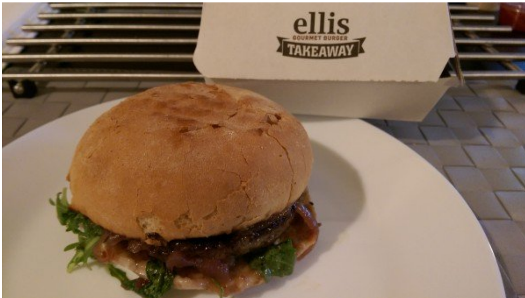
Hamburguer Ellis Gourmet.

Mesmo na opção para levar, carne estava no ponto perfeito.