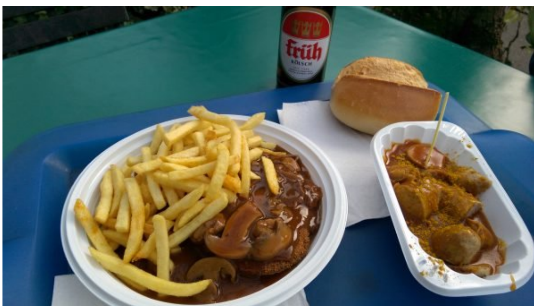
Comidinha de um dos restaurantes próximo ao