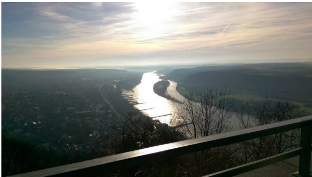
O Rio Reno!