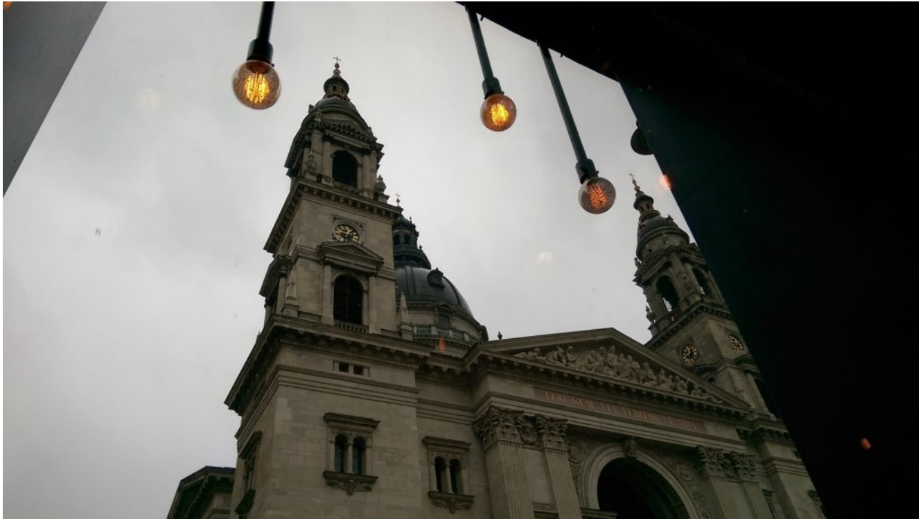
Brewpub e casa de carnes tem vista para a Catedral.

recomendada casa de carnes, optamos por provar pratos de comida tradicional húngara e não nos arrependemos. Além do goulash , preparos com pato são bem tradicionais no país. Provamos o goulash preparado por eles, assim como linguiça de porco mangalica e linguiça de pato.