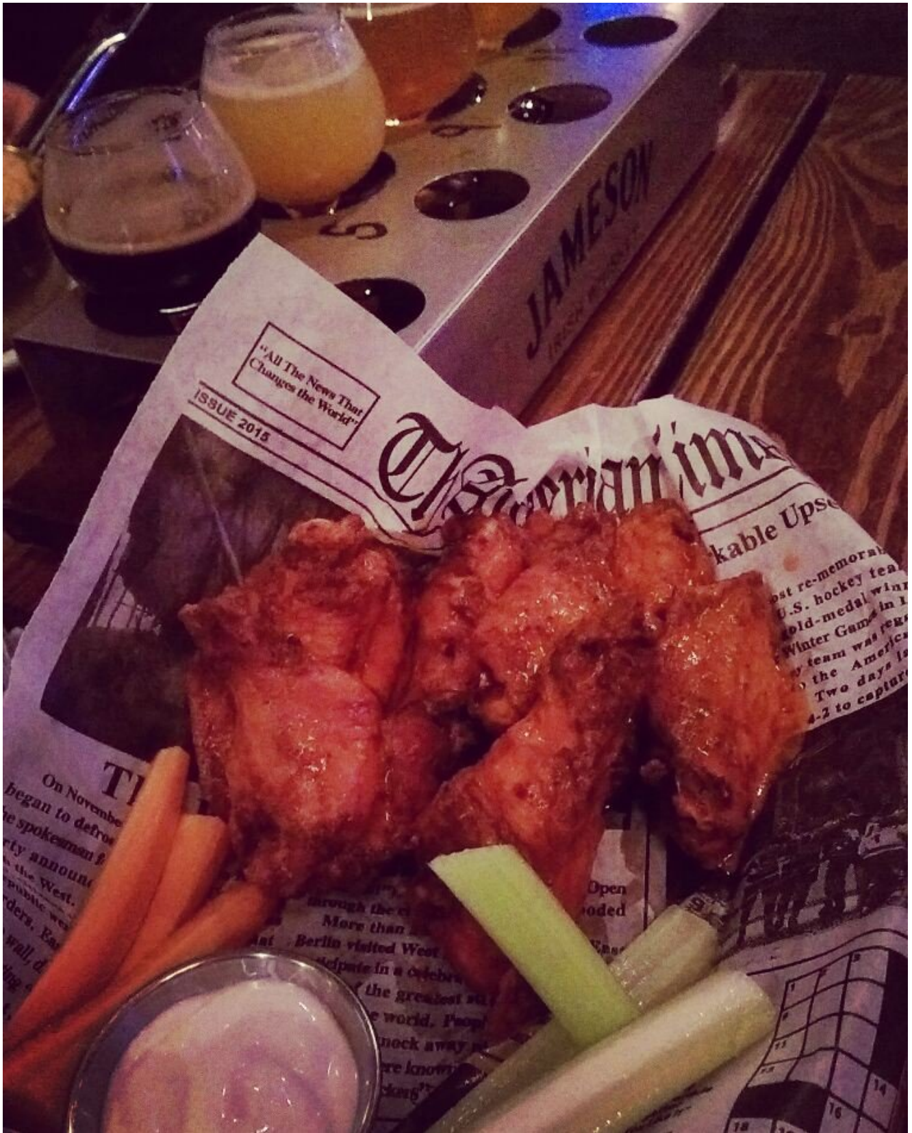
--- Hearthland Brewery – para beber boas cervejas com vista para a Times Square.