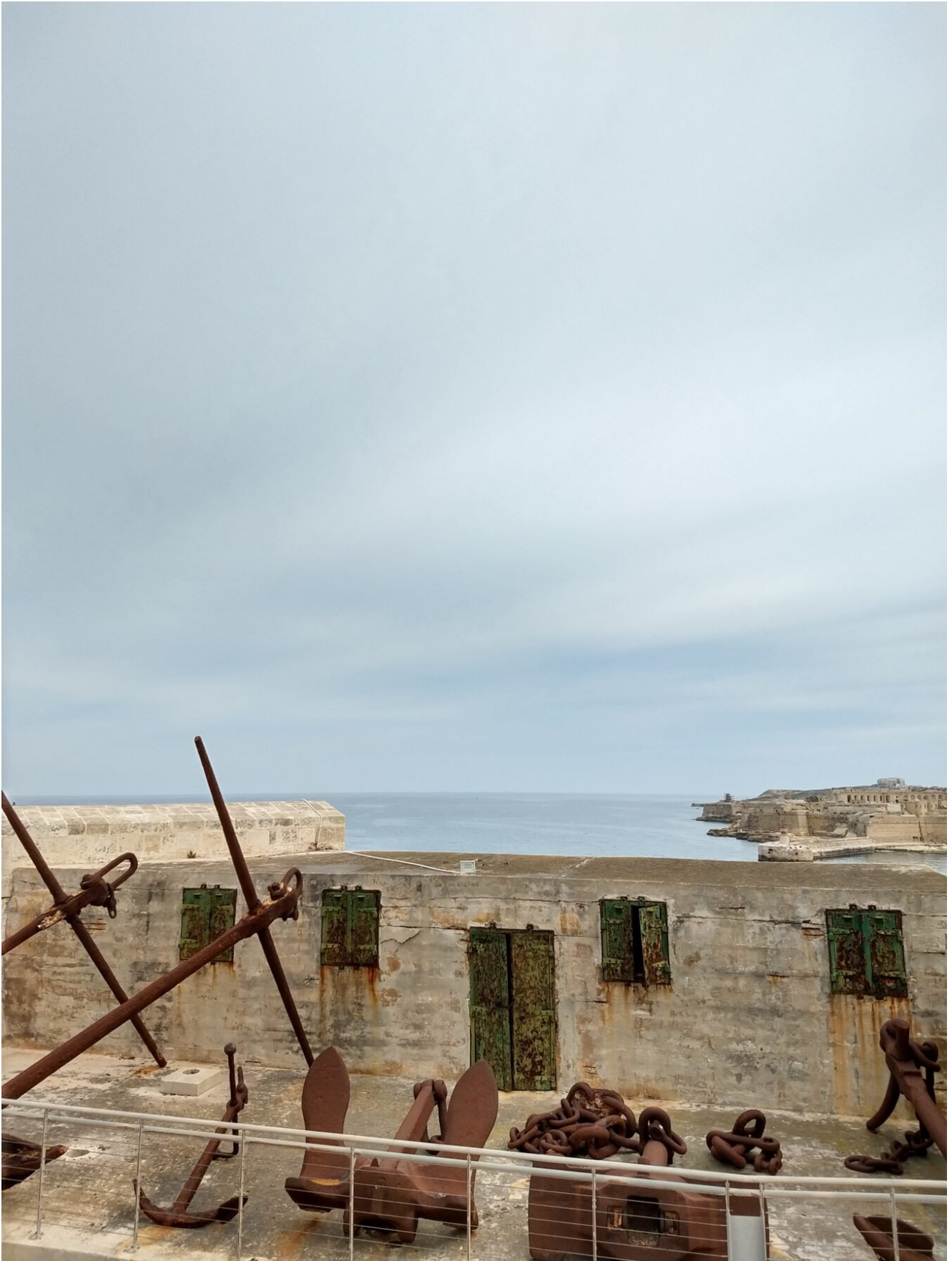
— — — ▪ Barraka Gardens , também chamados de Jardim Barraka