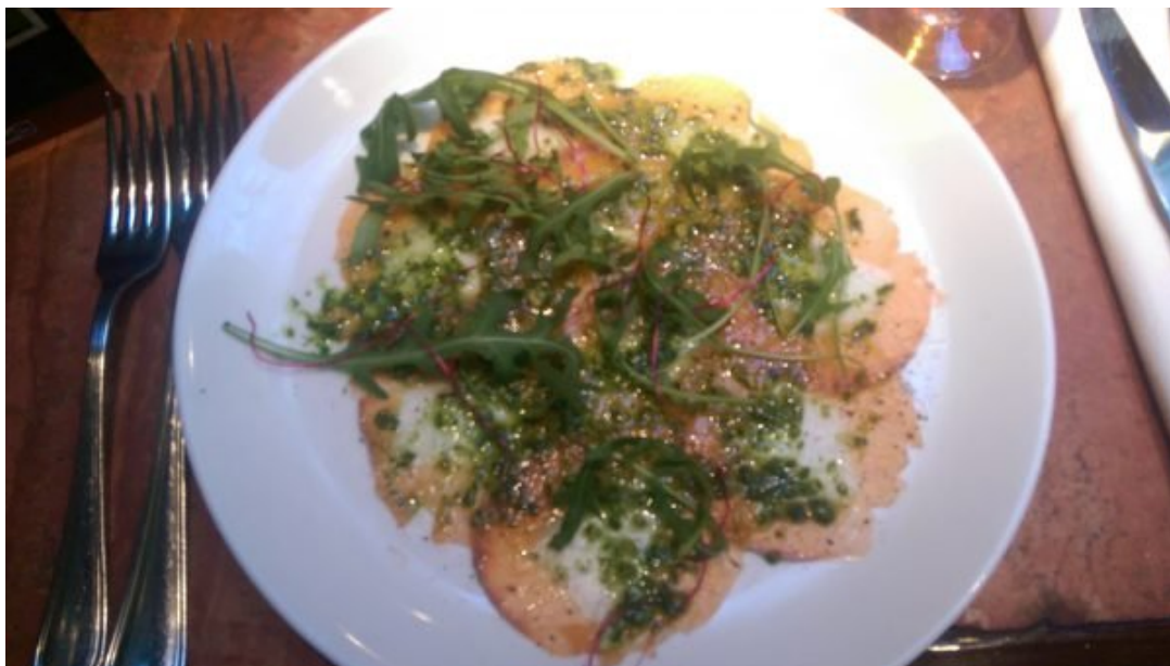
Carpaccio de Peixe.

Na ocasião em que fomos ao La Quincaillerie , provamos Business Lunch e estas as nossas escolhas (o cardápio é divulgado toda segunda-feira, no site e você pode se cadastrar para receber por e-mail):