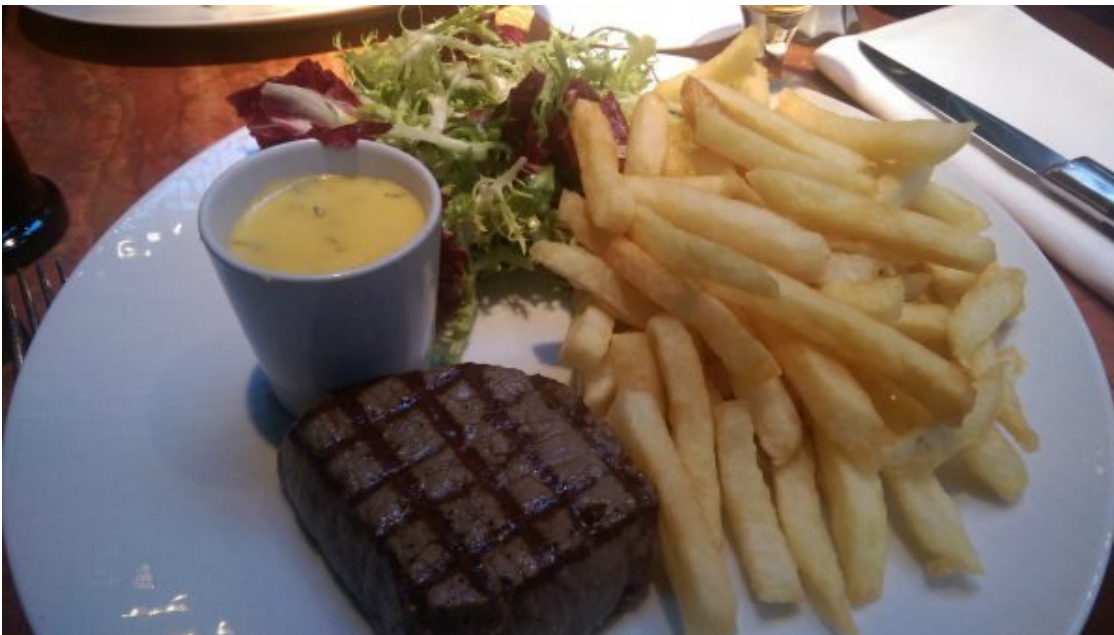
Steak com Molho Bernaise e Batata Frita.