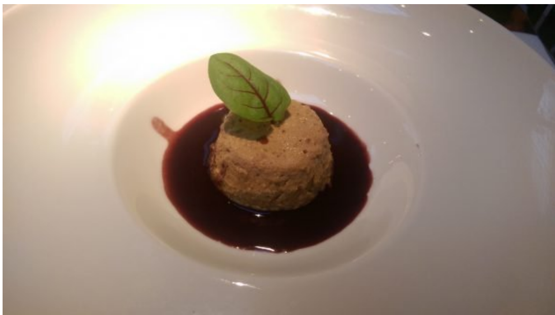
Flan de Fígado de Galinha com Caldo de Beterraba.