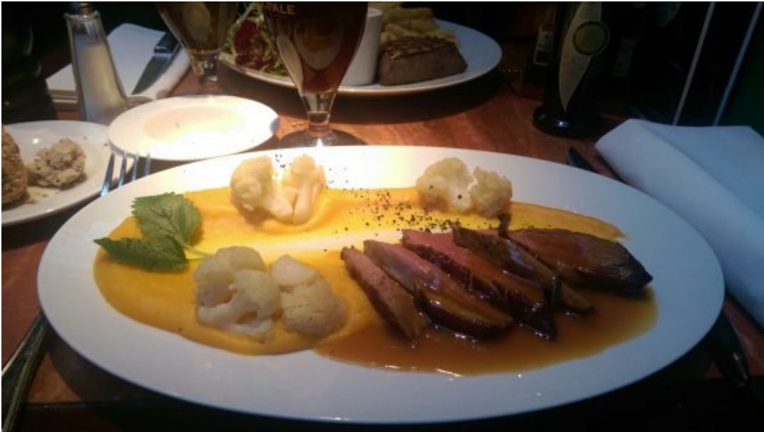
Magret de Canard com Purê de Cenoura.