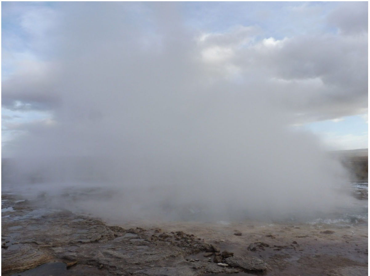
Na sequência, o géisir Strokkur em atividade.