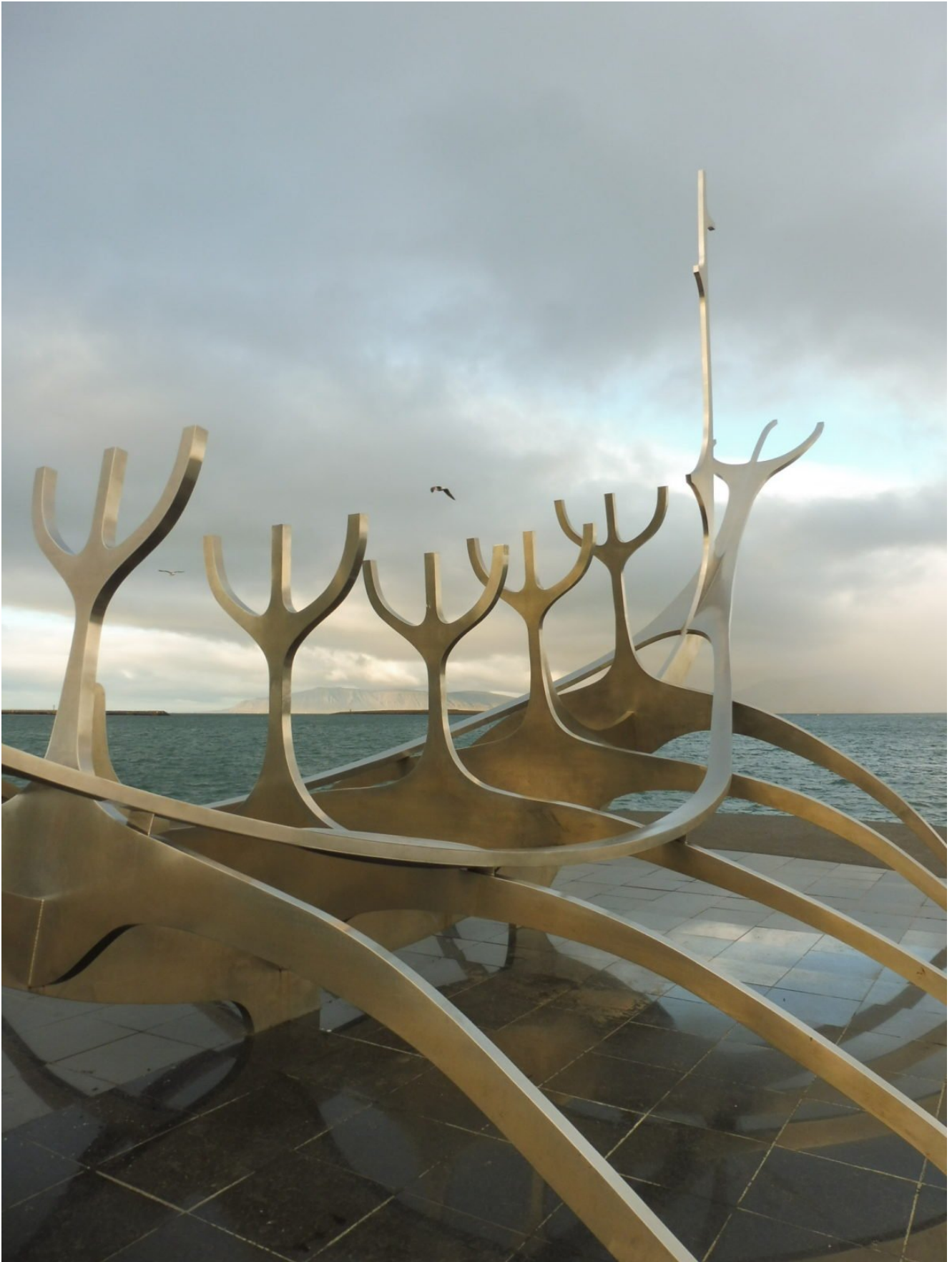
▪ Jardin de Esculturas, The Einar Jónsson Museum