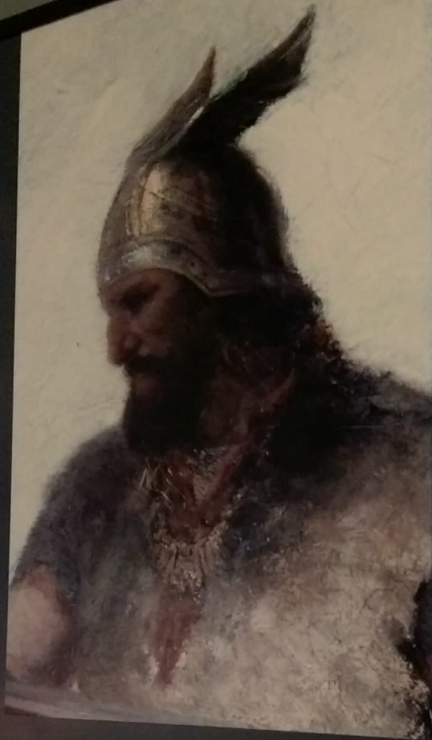
IMAGE OF THE VIKINGS

Fueled by the idea of a noble and heroic past, Romantic period painters, poets, and authors constructed an image of the Vikings that is at odds with our modern understanding of the Viking Age. "The Norwegian Landing on Iceland", painted by Oscar Wergeland in 1877, has typical Romantic-era depictions of sea-faring Norsemen: a brave leader shows the way, while a wise old story-teller sits behind. Many details such as the fur clothing, winged-helmet, and heavy, cave-built ship, had no archaeological basis. A few years later, the excavation of the Gokstad ship revealed the fine craftsmanship of Viking Age shipwrights.