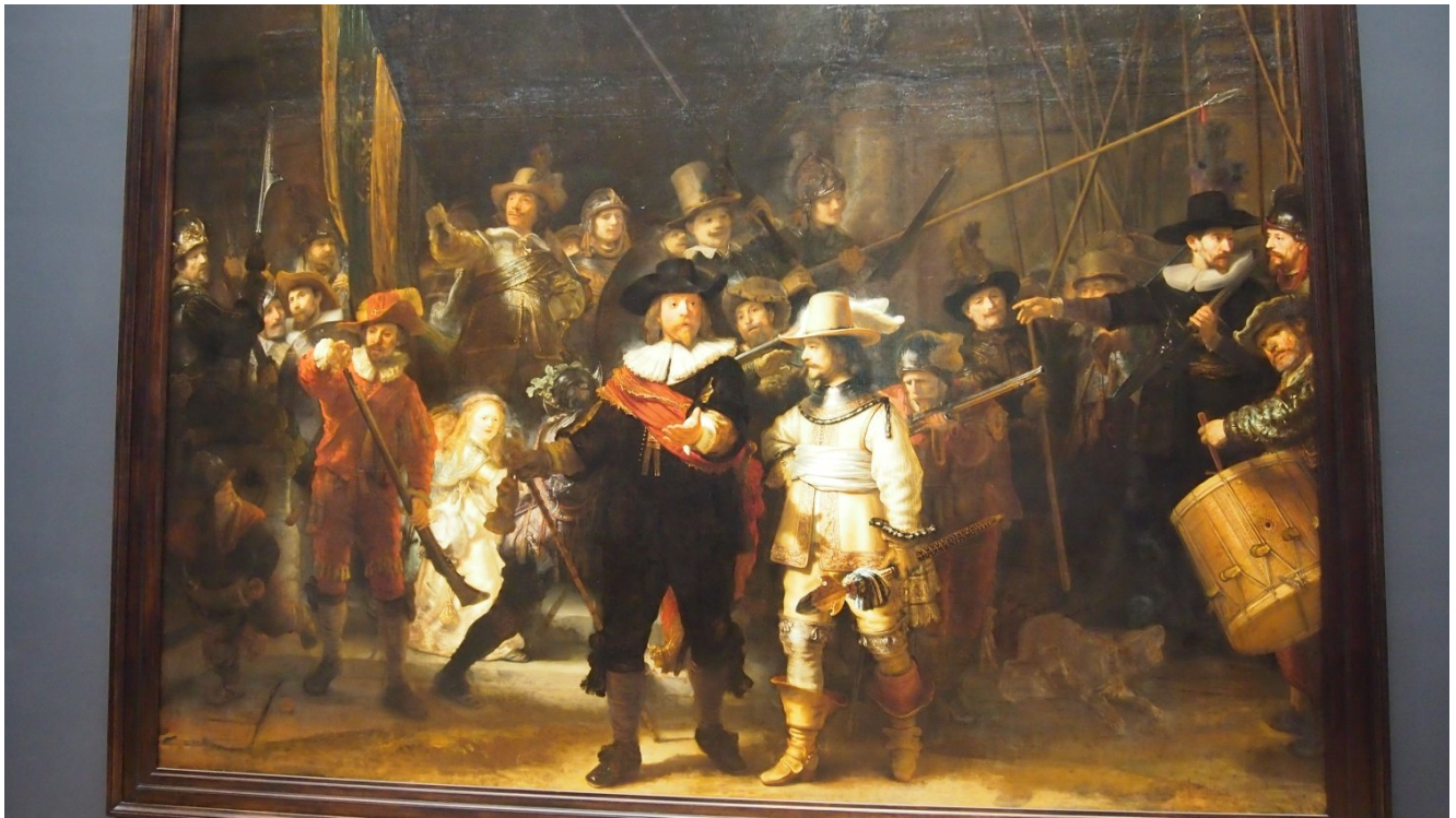
A Ronda Noturna de Rembrandt.