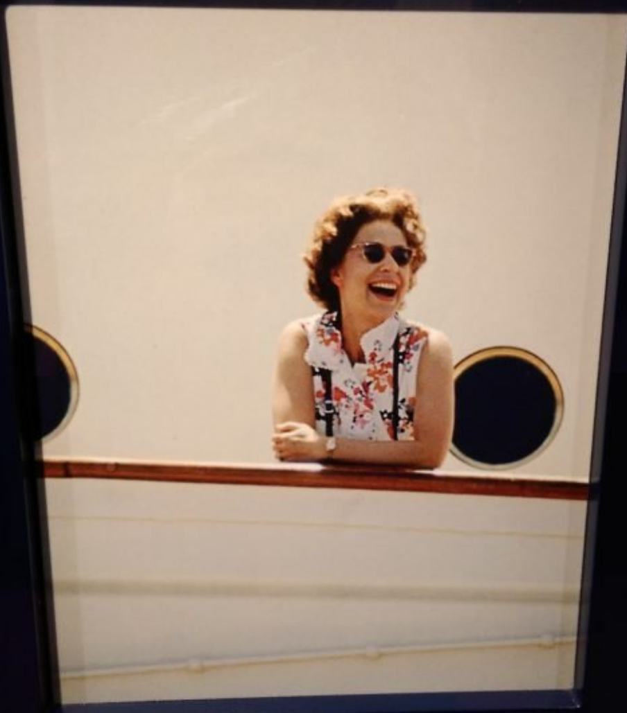
The Queen on Western Isles Cruise.