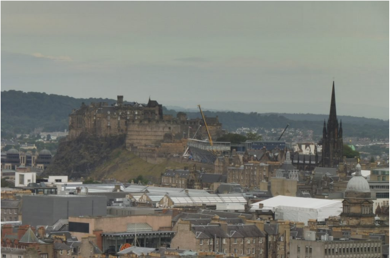
View de Edimburgo a partir de Arthur's Seat.