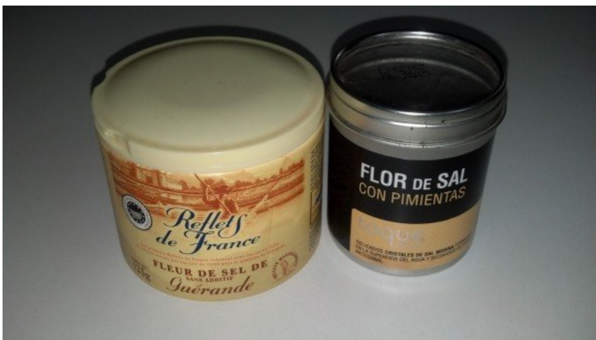
Flor de Sal!