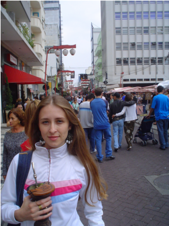
Com a cuia na Liberdade, São Paulo.