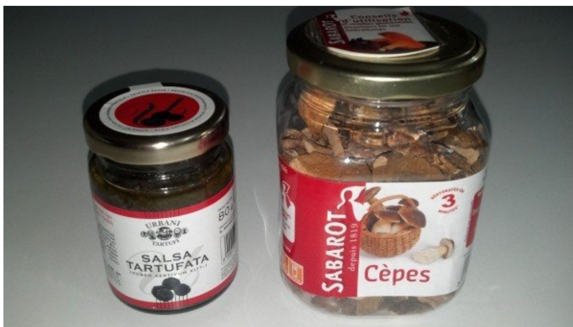
Salsa trufada que ganhei dos afilhados que estiveram na Itália! Ao lado, cogumelos franceses que compramos no Carrefour.