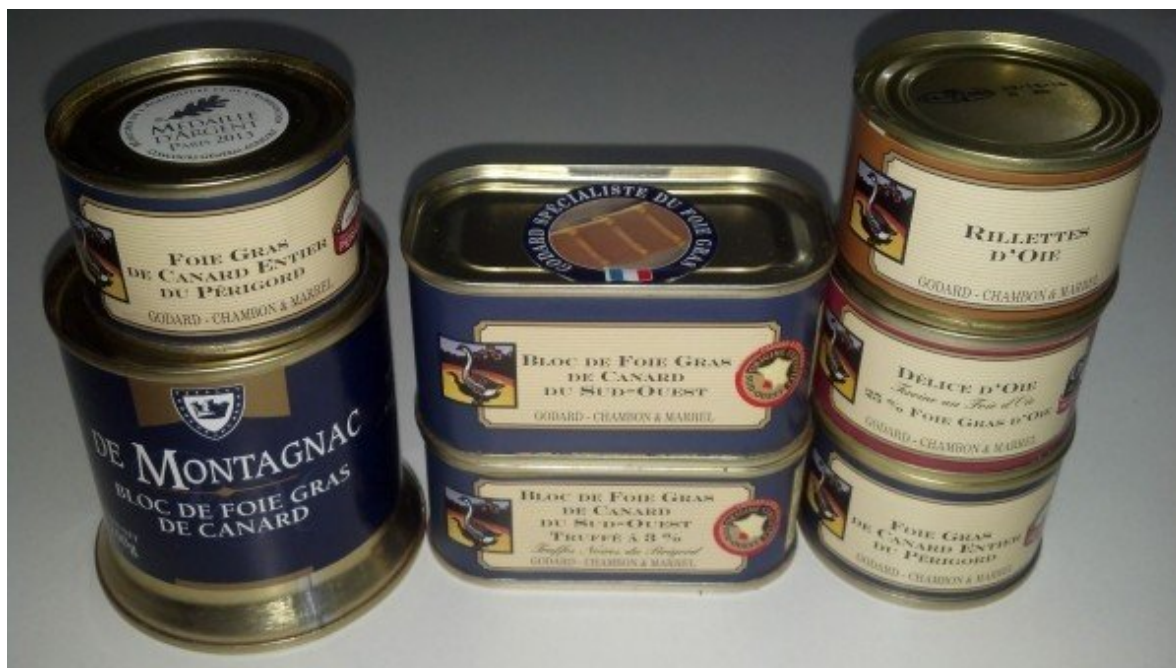
Patês e Foies franceses.