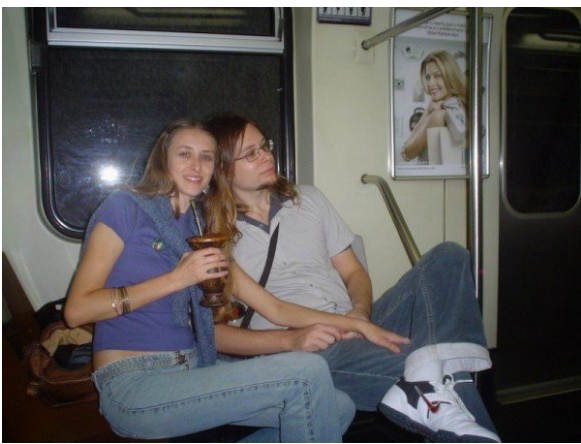
Com o chimas no Metrô em SP.

Em Salvador : levamos, mas o calor não nos permitia ter vontade de tomar algo quente, então quase não tomamos. Por vezes, era até meio incômodo ficar carregando, por isso é sempre bom levar em consideração o lugar para onde se vai viajar.