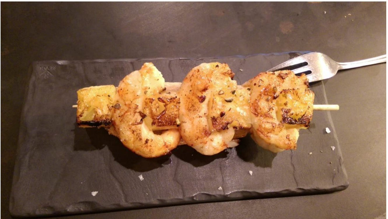
Espetinho de camarão com abacaxi.

Site oficial: BierCab Cerveja e Gastronomia Endereço: Carrer de Muntaner, 55 – 08011 – Barcelona – Espanha