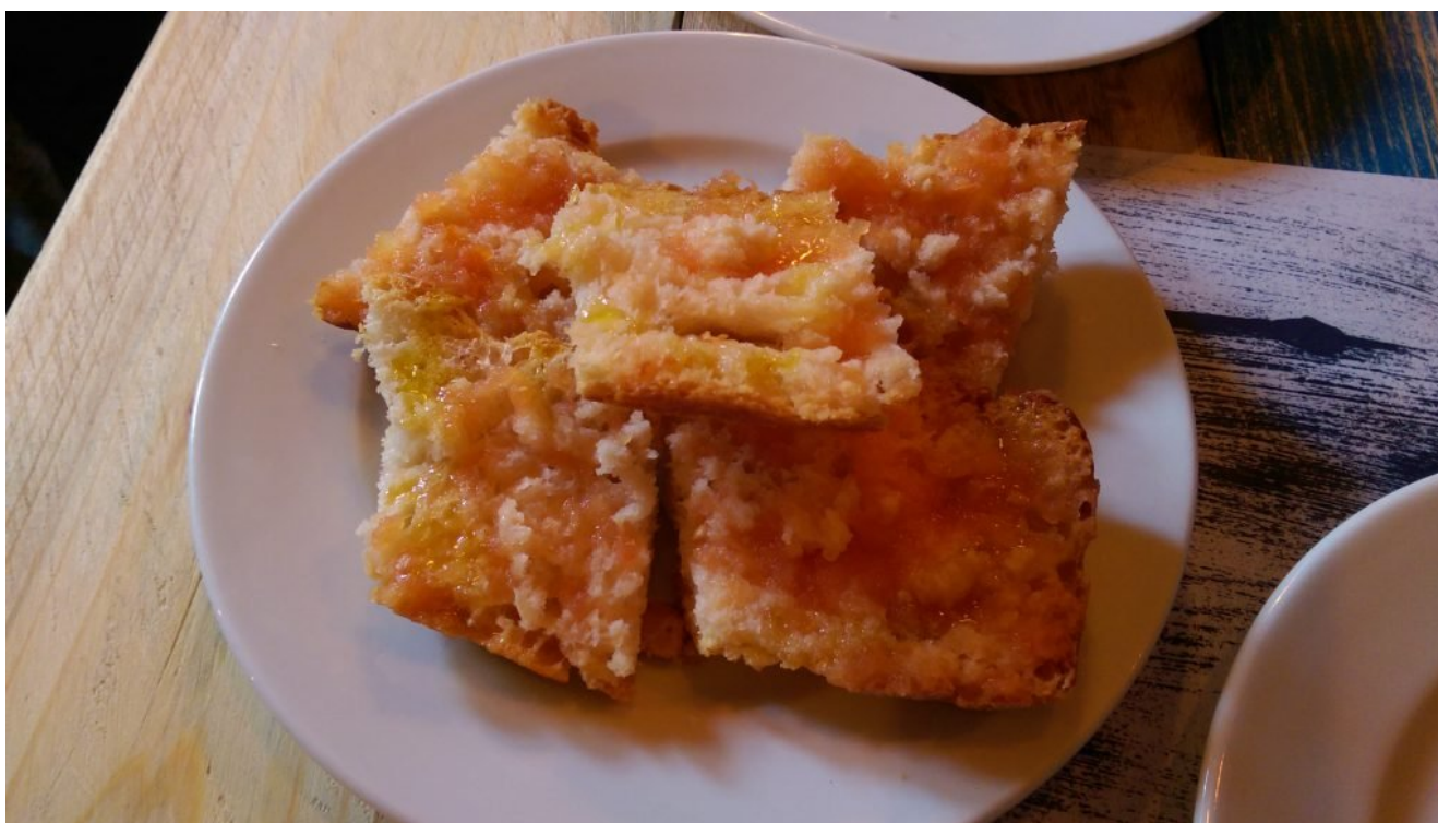
Pa amb tomàquet.

Bar de tapas e restaurante para quem quer provar peixes e frutos do mar bem frescos, com alguns dos melhores tapas que provamos em Barcelona! Destaque para a alcachofra frita com raspas de foie gras , divina! Nada de grandes cervejas, mas a gente sempre encontra alguma coisa!