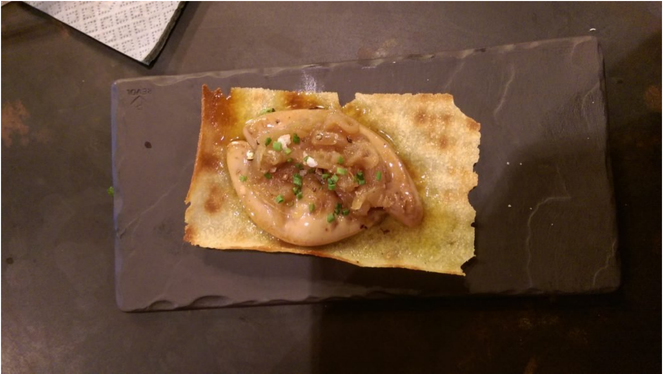
Tapa de foie gras.