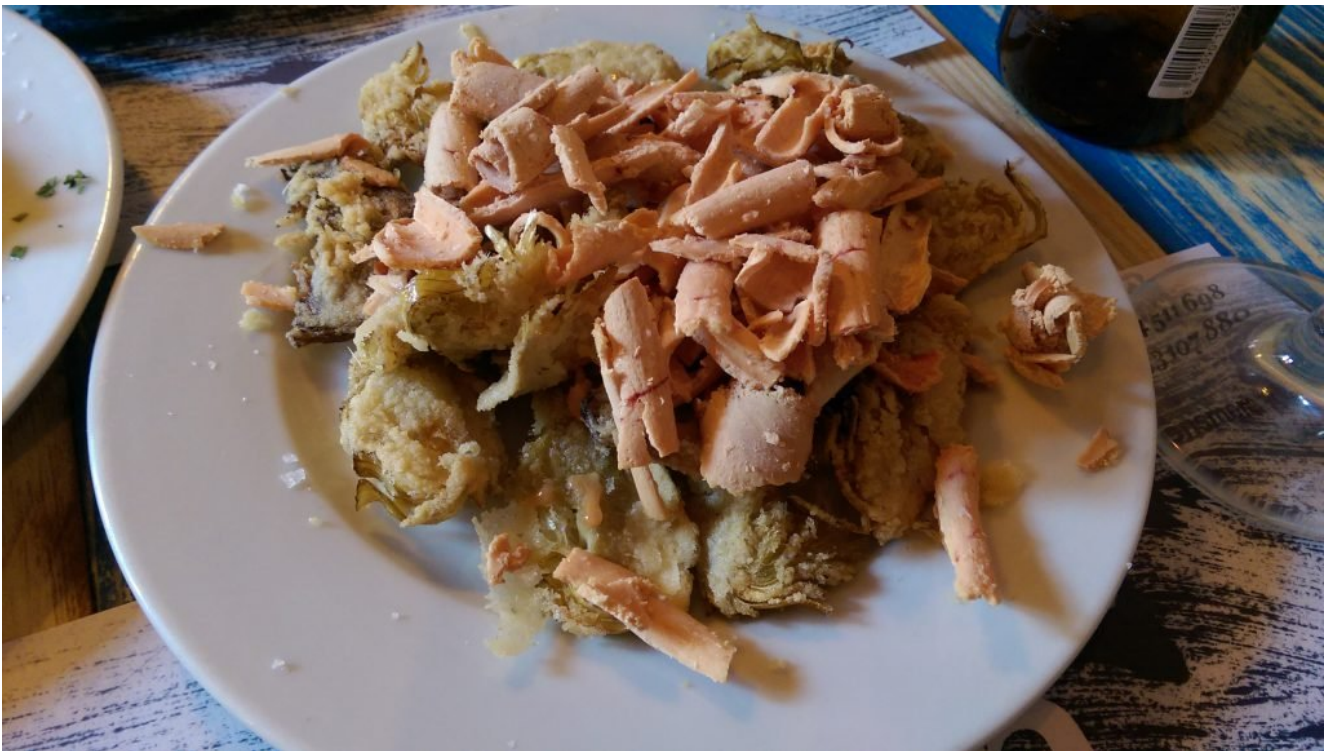
Alcachofra frita com raspas de foie gras.